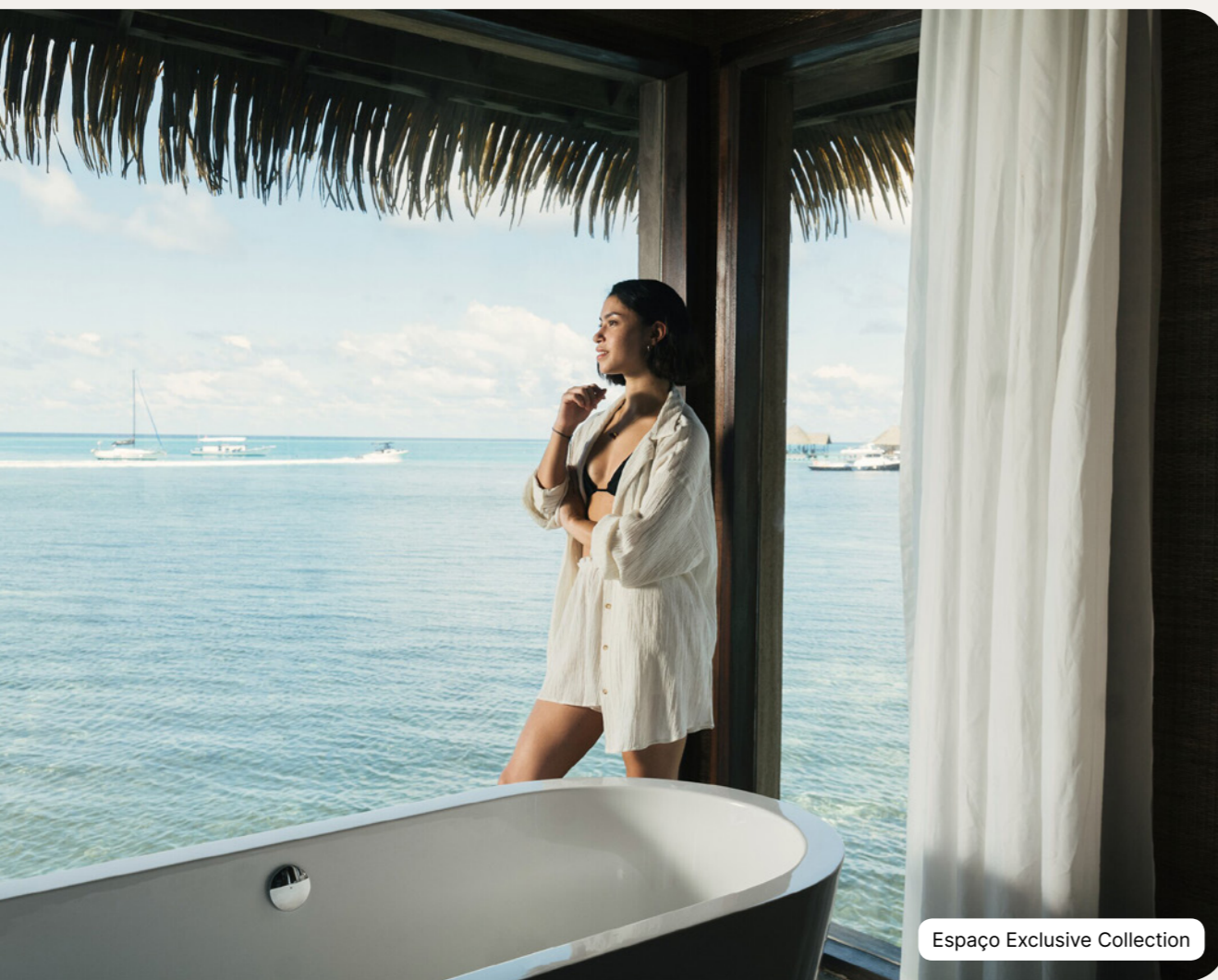
Espaço Exclusive Collection