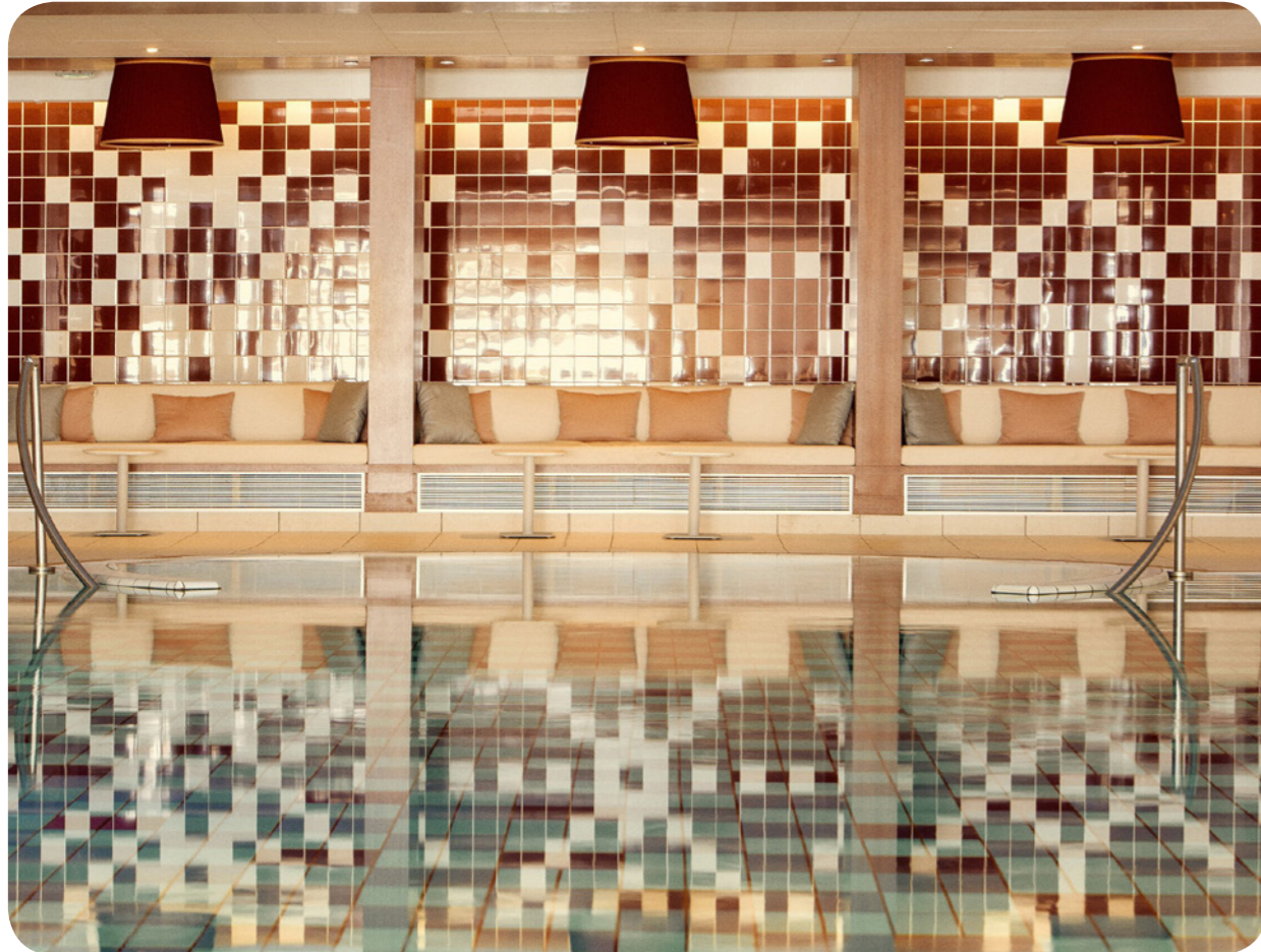
넓은 창문과 휴식 공간이 있습니다. 수심 (최소/최대): 1m / 1.4m 난방