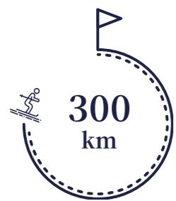
알파인 스키 슬로프