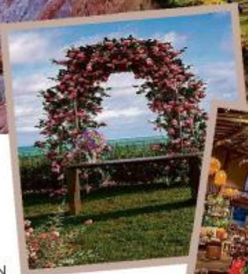
O Club Med dispõe de um espaço interno e externo para montar as cerimônias

Conforme a pandemia foi arrefecendo, no fim do ano passado, o número de matrimônios no país voltou a subir. De acordo com a Associação Nacional dos Registradores de Pessoas Naturais (Arpen-Brasil), o aumento foi de 21%