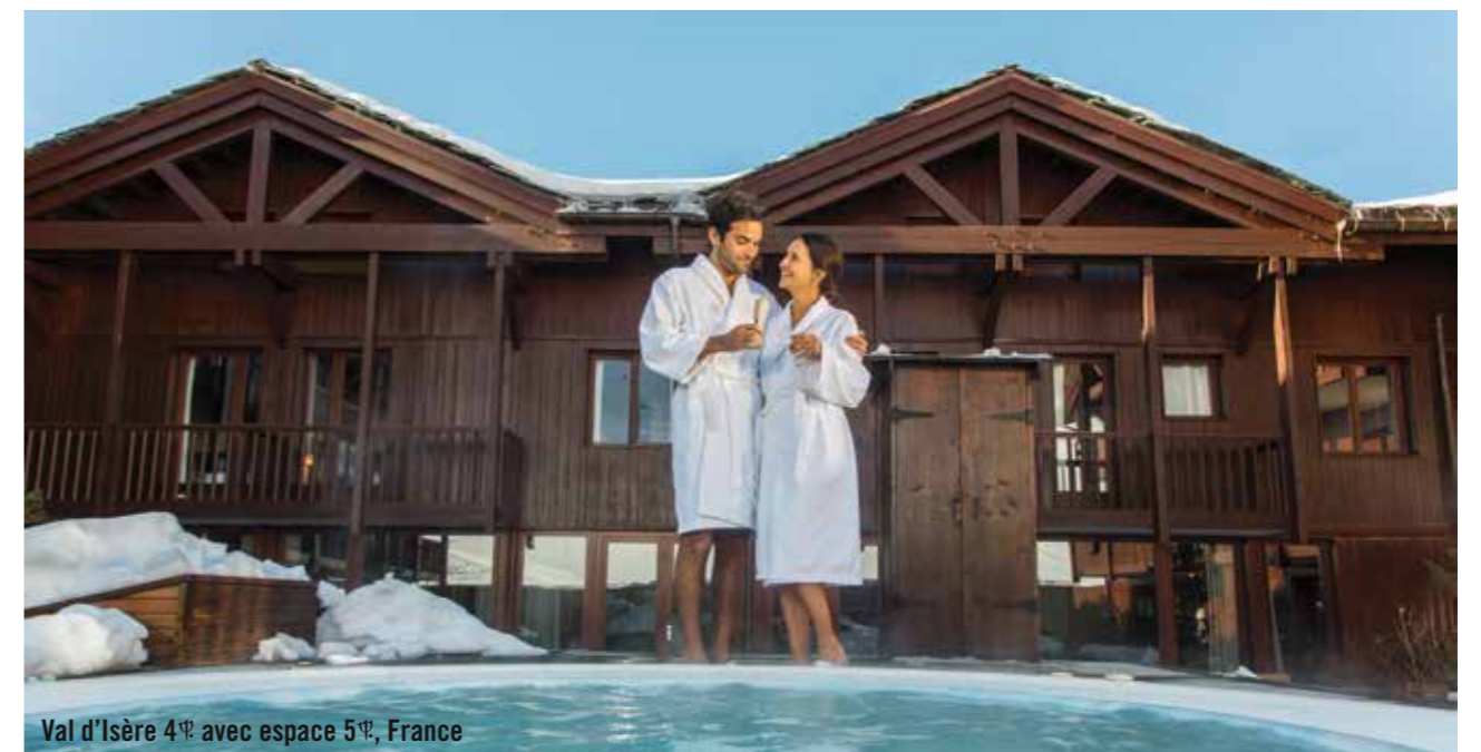
Val d'Isère 4Ψ avec espace 5Ψ, France