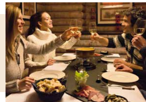
*Présent dans la plupart de nos Villages.

Savourez une pause gourmande directement sur les pistes dans l'un des restaurants d'altitude partenaires des Villages de Chamonix, Pragelato Vialattea, St Moritz Roi Soleil, Cervinia et Villars-sur-Ollon (inclus dans votre forfait).