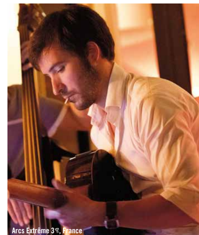
Arcs Extrême 3 ® , France

Rendez-vous sur la piste de danse pour boire un cocktail entre amis et danser.