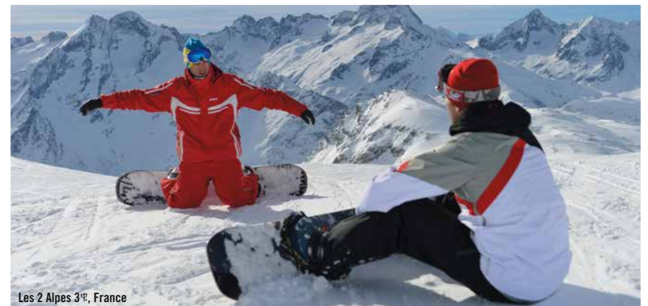
Les 2 Alpes 3 e , France

L'Ecole du Ski Italien dans nos Villages italiens