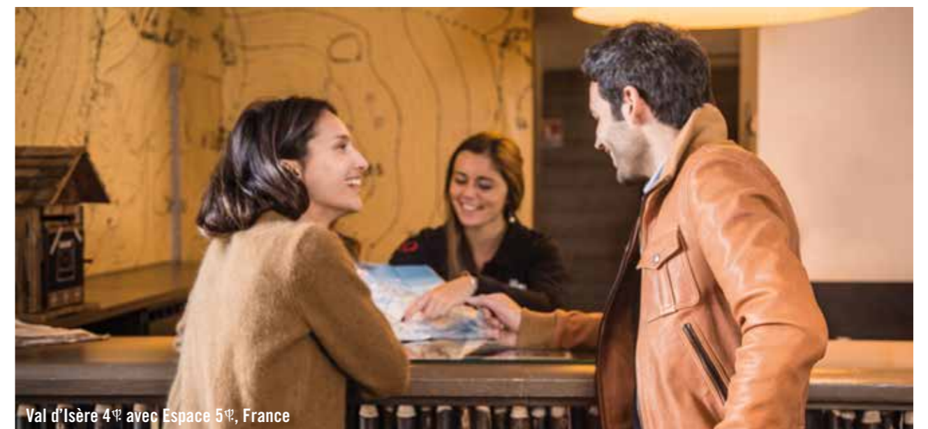
Val d'Isère 4⚡ avec Espace 5⚡, France

Une demande spéciale ? Un imprévu ? Rendez-vous à la réception, nos G.O® s'occupent de tout.