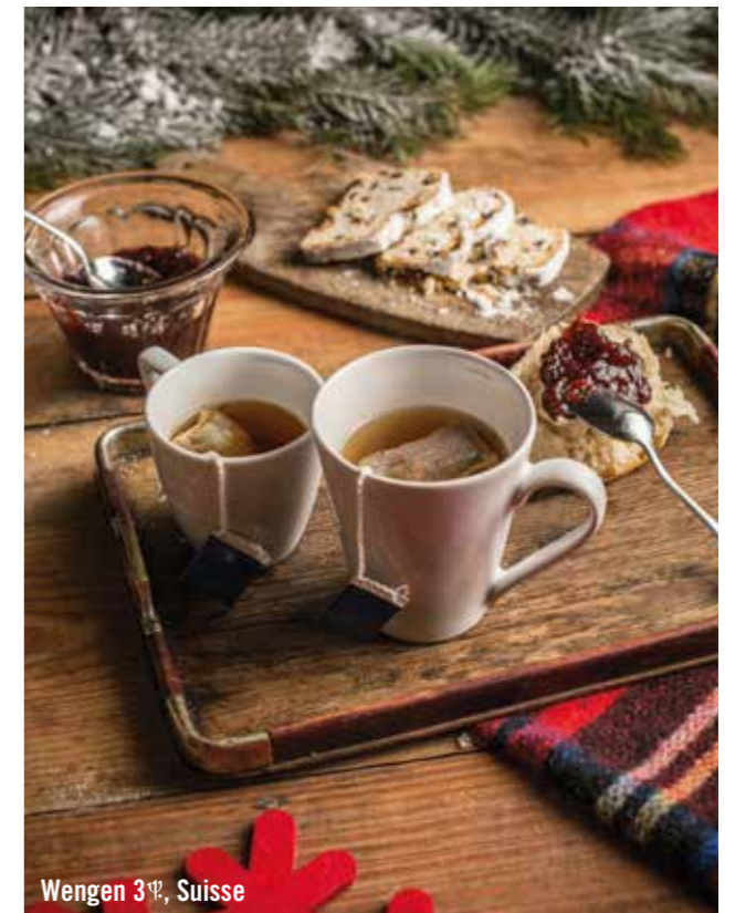
Wengen 3 e , Suisse

Profitez de boissons fraîches, cocktails classiques ou originaux, encas ou apéritifs gourmands dans les bars de nos Villages.