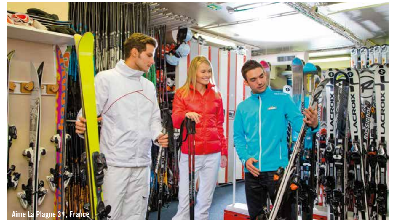
Aime La Plagne 3 e , France

Préparation et mise à disposition de votre matériel dans votre casier avant votre arrivée, pour profiter dès les premiers instants.