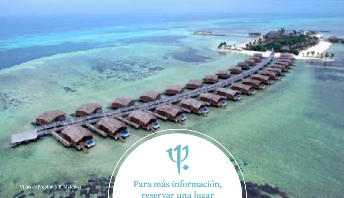
Villas de Finolhu 5Ψ, Maldivas