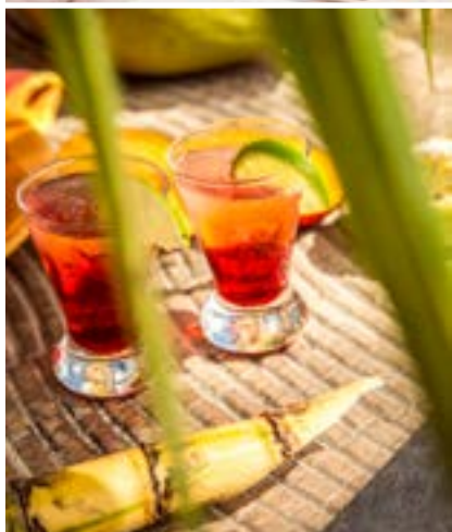
Hay bebidas y tentempiés a su disposición durante todo el día.